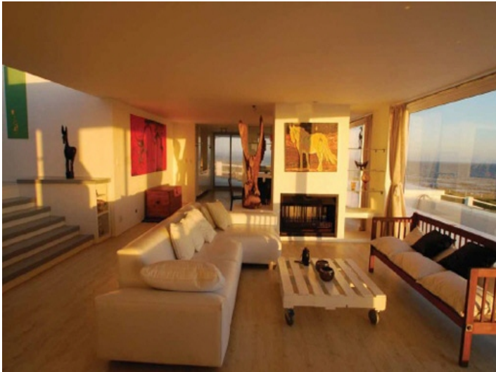
Wohnzimmer mit großen Sofa