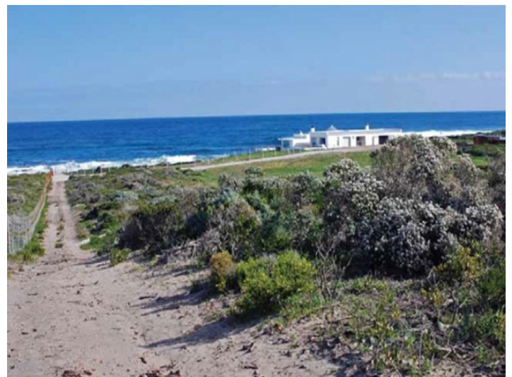
Weg zur Villa