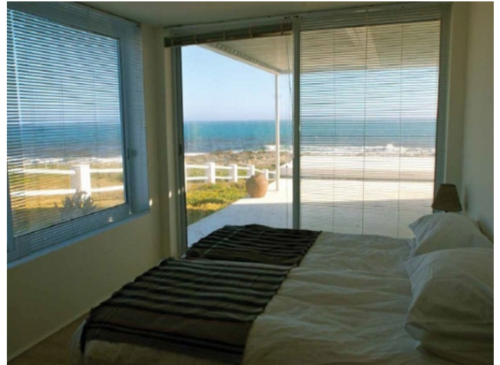
Schlafzimmer mit atemberaubendem Meerblick